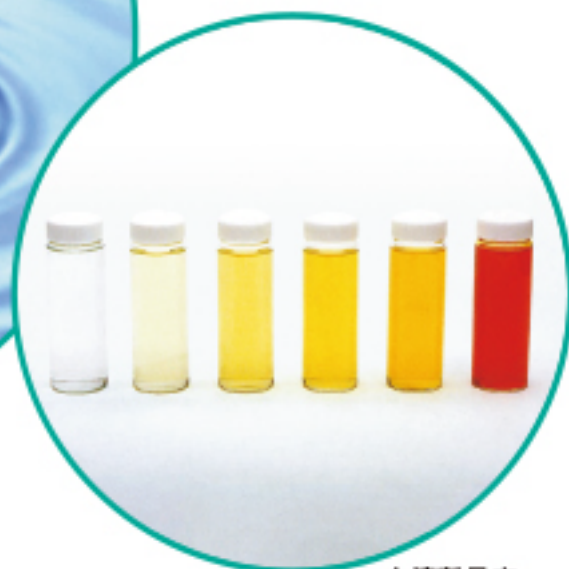
▲液剤見本 水100mlに対するCoQ10含有量 左端からブランク、10mg、30mg、 50mg、100mg、原液（10%液）